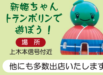
新姫ちゃん トランポリンで 遊ぼう！